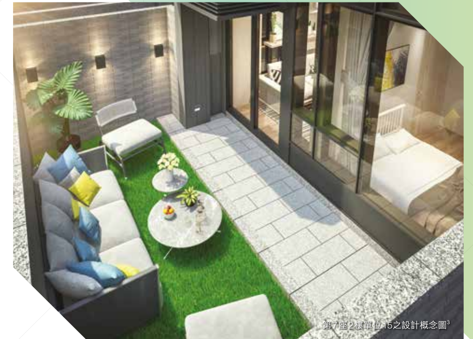
第7座2樓單位15之設計概念圖 3

此等單位及私人花園或私人平台內之裝置、裝修物料、設備、佈置及傢俱並非交樓標準。有關單位之裝置、裝修物料及設備詳情，請參閱售樓說明書。