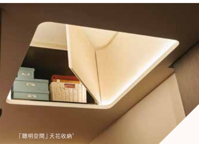
「聰明空間」天花收納 1

雅尚園林生活概念，由室外延續至每室每戶；「帝御·嵐天」室內設計配置，一磚一瓦，處處展現細緻心思。由著名室內設計 Studio HBA 赫室負責單位設計，採用弧形曲線及木質色調演繹豪華遊艇概念，品味非凡。