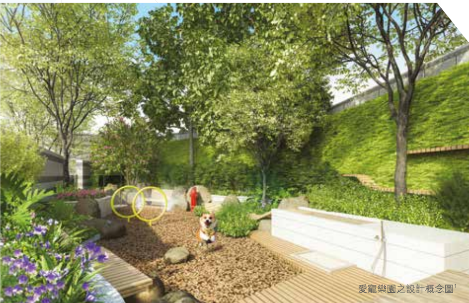
愛寵樂園之設計概念圖

平台特設「燒閒樂」地帶，讓你隨興之所至，約同三五知己同享燒烤之樂；於優雅花園環境與閃爍池畔光影之中，享受共敘暢快時光。以後毋須再費時張羅，燒烤，從此變得更隨時、隨心、隨意！