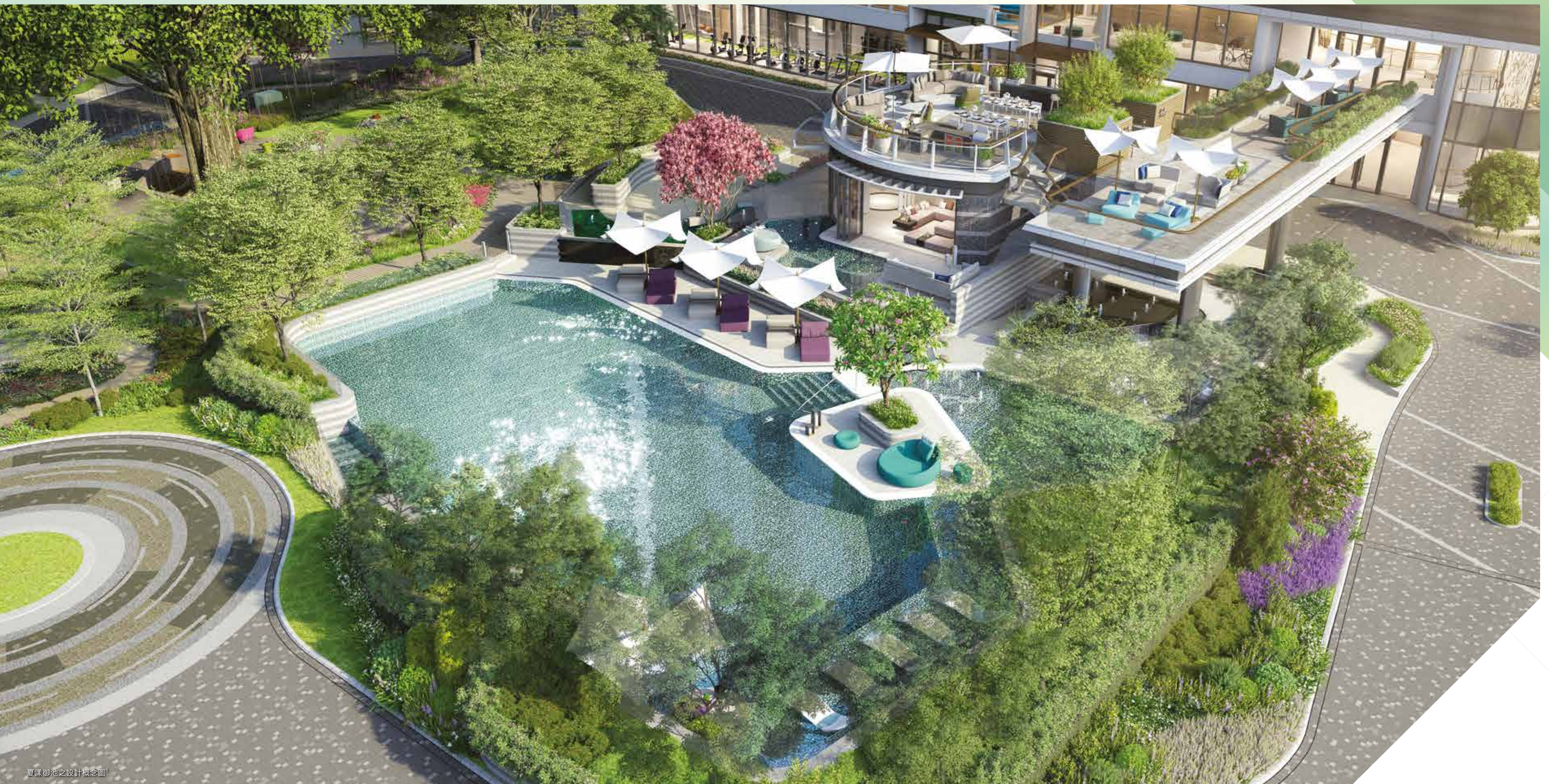
夏漾御池之設計概念圖 1

「帝御·嵐天」環抱以春夏秋冬四季為主題之綠化園林及泳池水景。加上廣泛綠化規劃，配合室外遊艇甲板式設計的空中步道及觀景平台。無論是身在居室之中，或是遊走於會所與園林之間，皆可享受城市綠州生活，領略令人神往之自然氣息。