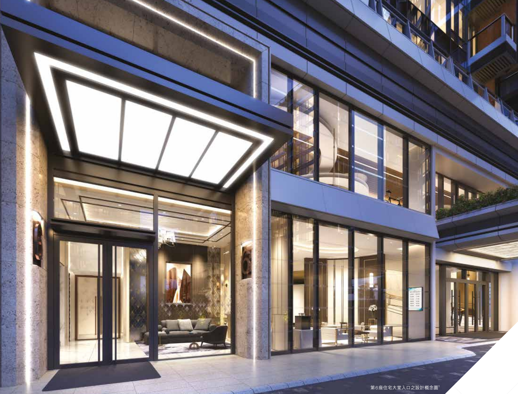
第6座住宅大堂入口之設計概念圖 1