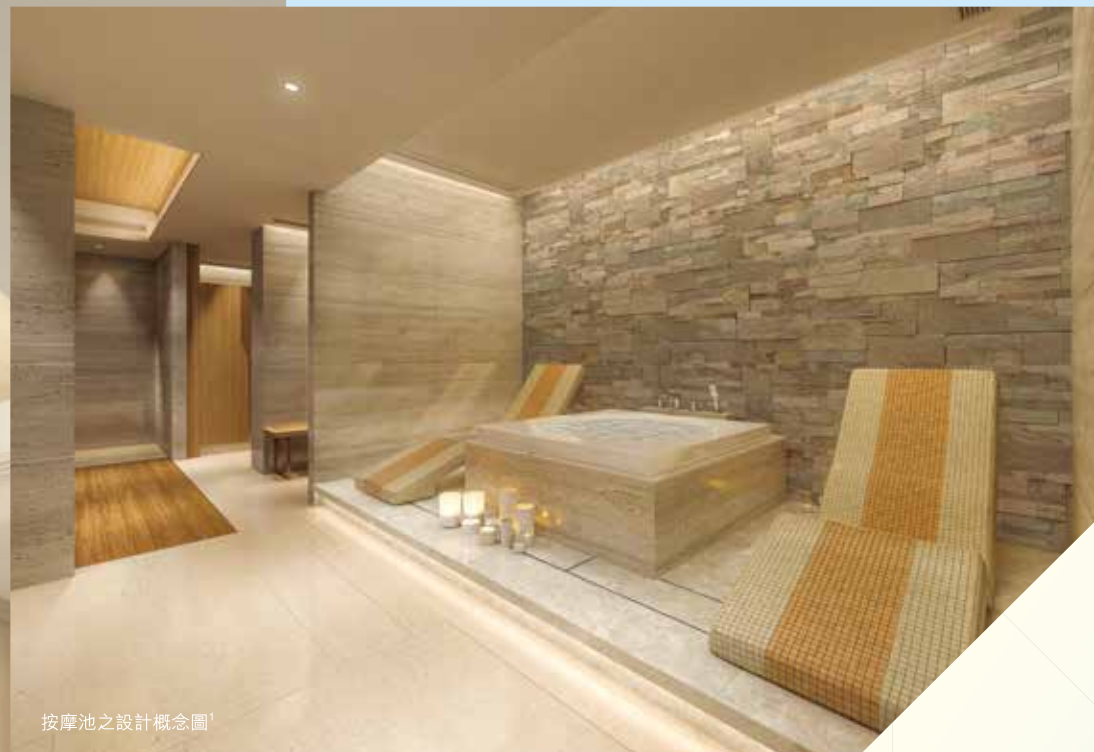
按摩池之設計概念圖

經過一日勞碌工作，回到 Club Royale 2 ，頃刻投入 Jacuzzi 按摩浴池之中，盡消疲憊；意猶未盡的話，更可享受一下岩鹽桑拿浴，蒸發一身汗水；一乾一濕，舒緩排毒，渾身感覺煥然一新。