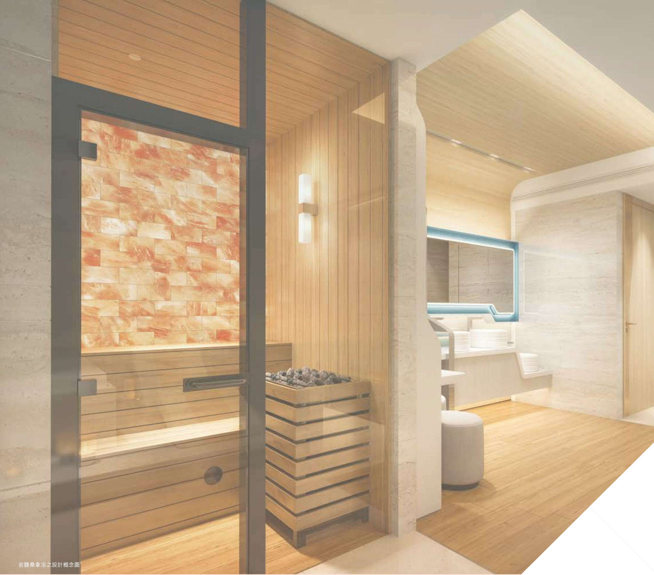
岩鹽桑拿浴之設計概念圖