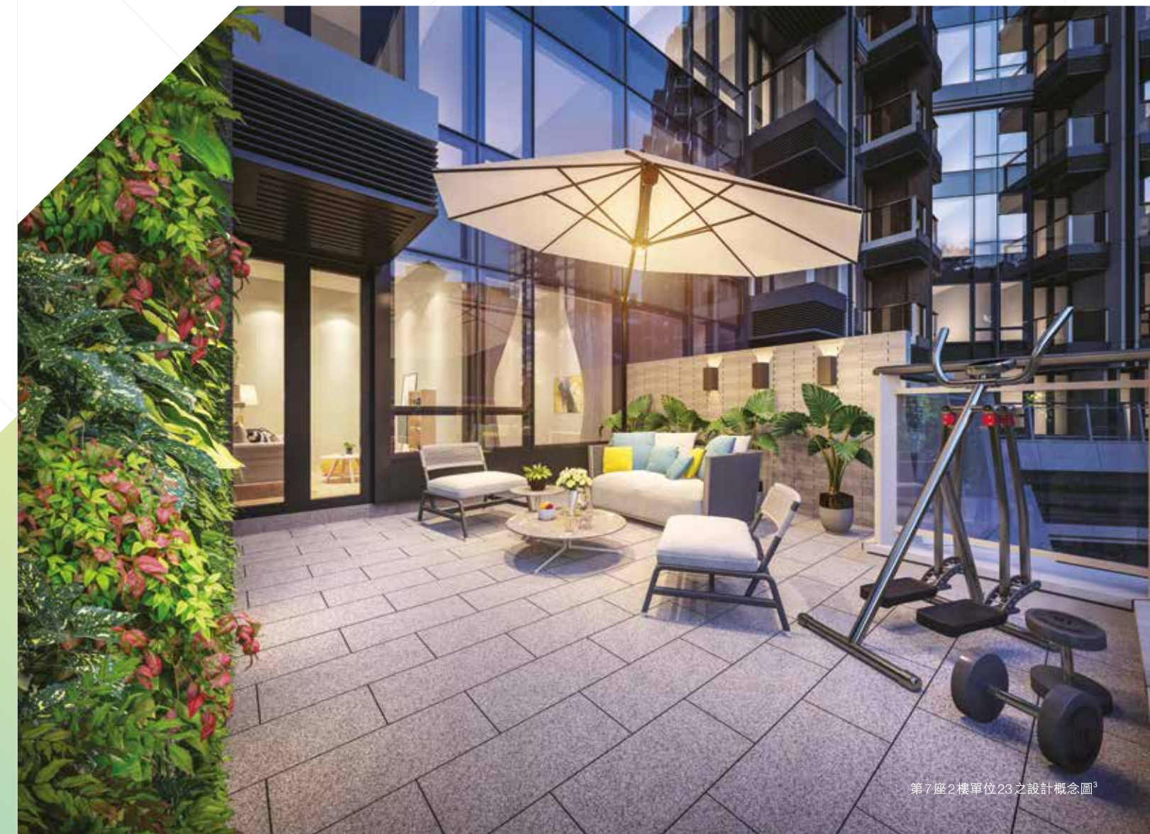
第7座2樓單位23之設計概念圖 3

全部「綠意嵐天」*特色單位之私人花園或私人平台均附設供水及供電設備，週末邀約三五知己，在家享受燒烤之樂，輕而易舉！