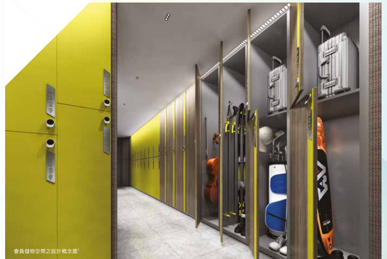
會員儲物空間之設計概念圖

熱愛運動和旅遊的您，家中總擁有大型裝置如行李箱、高爾夫球或滑雪裝備等。寓居「帝御·嵐天」，您就可將它們存放於專為住客而設的會員儲物空間；既可妥善保養存放，又可以騰出居室位置，一舉兩得。