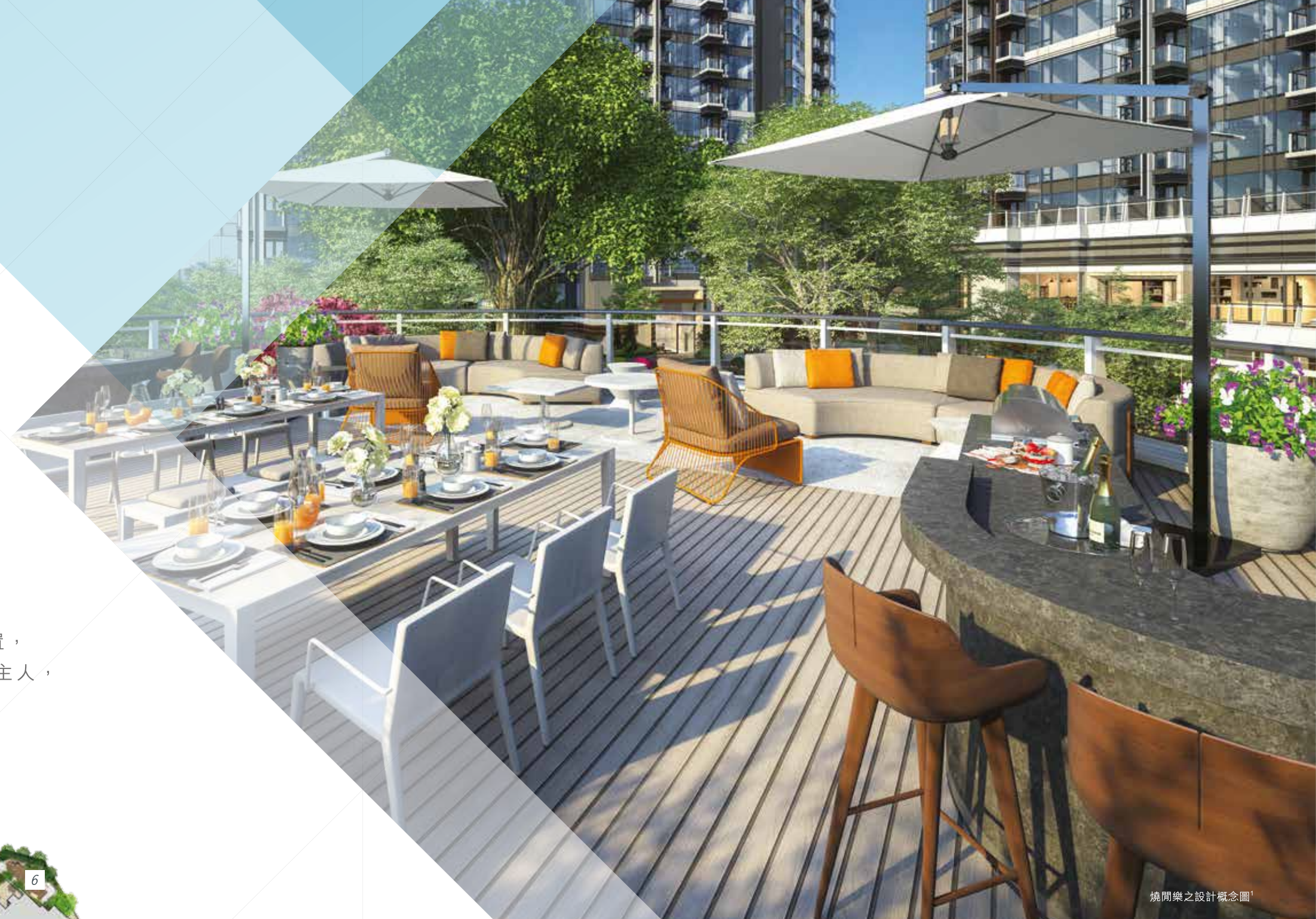
燒閒樂之設計概念圖

擁有寵物的您，「愛寵樂園」就是您和寵物的至愛小天地！在此您大可放心，讓寵物在其中自由自在，飛躍奔跑；更特設障礙和訓練裝置，讓寵物盡情釋放活力；而您則可和其他愛寵主人，交流飼養寵物樂趣，分享心得體會。