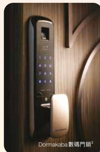
Dormakaba 數碼門鎖 3