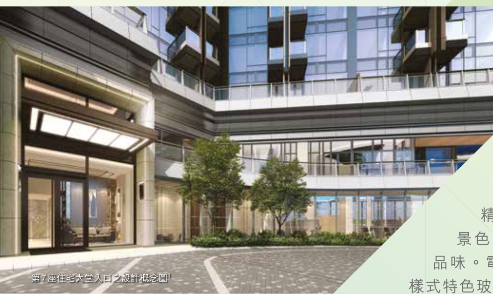
第7座住宅大堂入口之設計概念圖 1