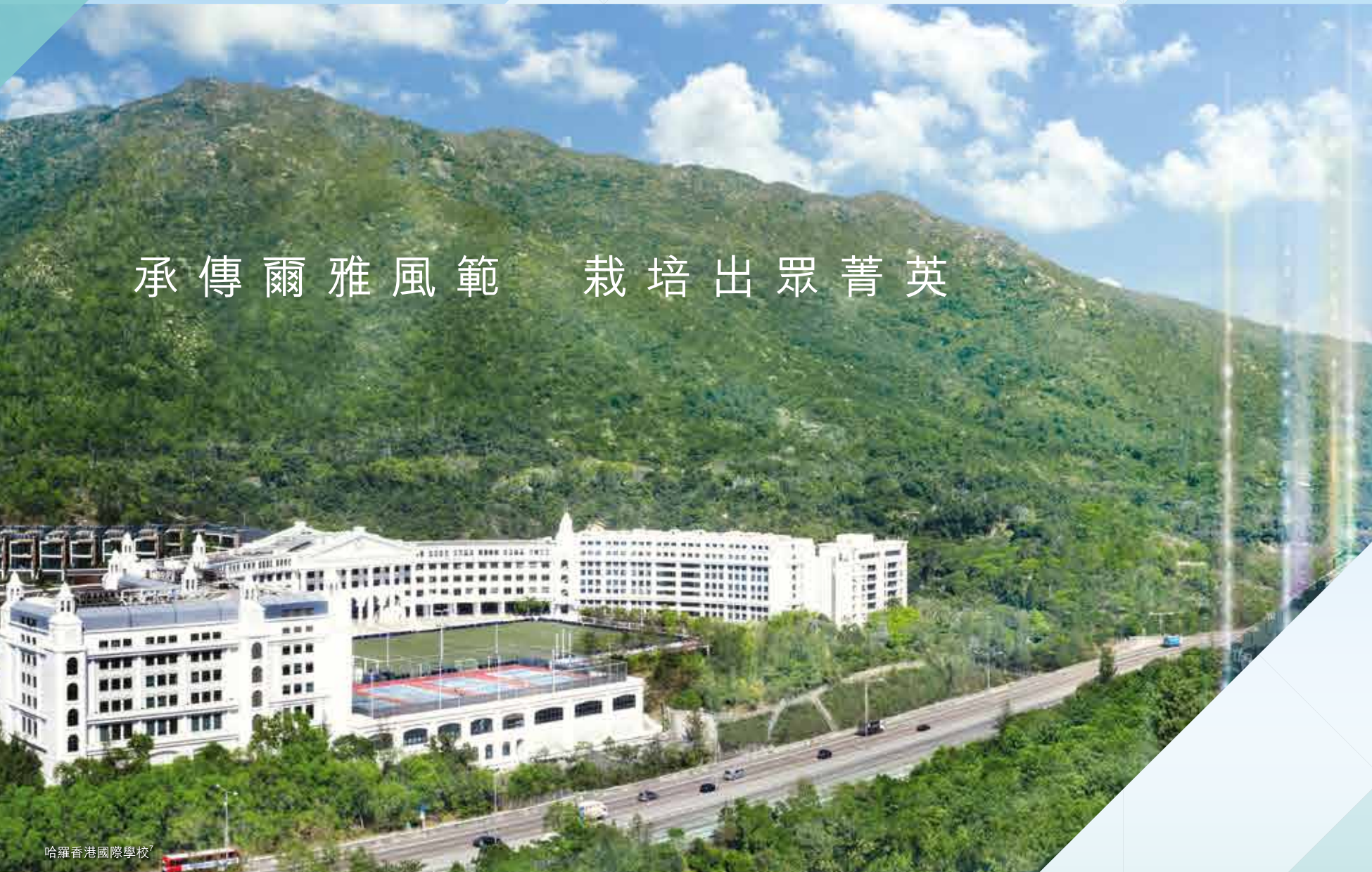
哈羅香港國際學校

哈羅香港國際學校，乃擁有「首相搖籃」美譽之哈羅公學於亞洲所開立之第三間分校，聲名卓著，曾孕育包括世界顯赫領袖 - 邱吉爾等歷代7名英國首相。分校提供幼稚園至18歲高年級13班教學，並與哈羅公學及約翰里昂學校為友校。宏偉校舍盤據山嶺，氣勢非凡；區內亦提供優質幼兒至大學教育配套，提供珍貴土壤，讓下一代茁壯成長。