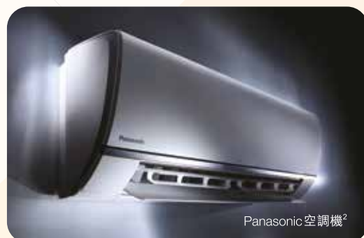
Panasonic 空調機 2